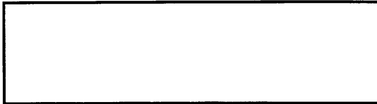
Схема границ эксплуатационной ответственности сторон

Прочие сведения по установлению границ раздела эксплуатационной ответственности сторон _____ _____ _____.